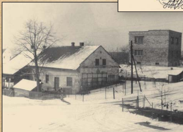
rodiný dům a novostavba