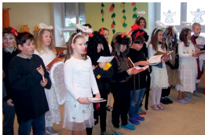
Mikulášská suita z 5.ročníku navštívila školku.

Rok utekl jako voda a máme před sebou Vánoce. Svátky, které jsou vnímány jako čas štědrosti, vděčnosti, víry, lásky a naděje v lepší budoucnost. O Vánocích se vytváří zvláštní kouzelná atmosféra. Každý ji prožívá jinak, ale určitě převládá láska, tolerance, soucit, přátelství. Někdo tráví svátky sám, jiný s rodinou, přáteli nebo jinými blízkými lidmi. Stejně jako nám se vybavují vzpomínky z mládí a dětství, zůstanou vzpomínky na tyto dny v mysli dnešní mladé generace. Advent. Slovo je latinské a znamená „příchod“. Děti ve škole jsou seznamovány s charakteristikou adventního období, které vrcholí 24. prosince na