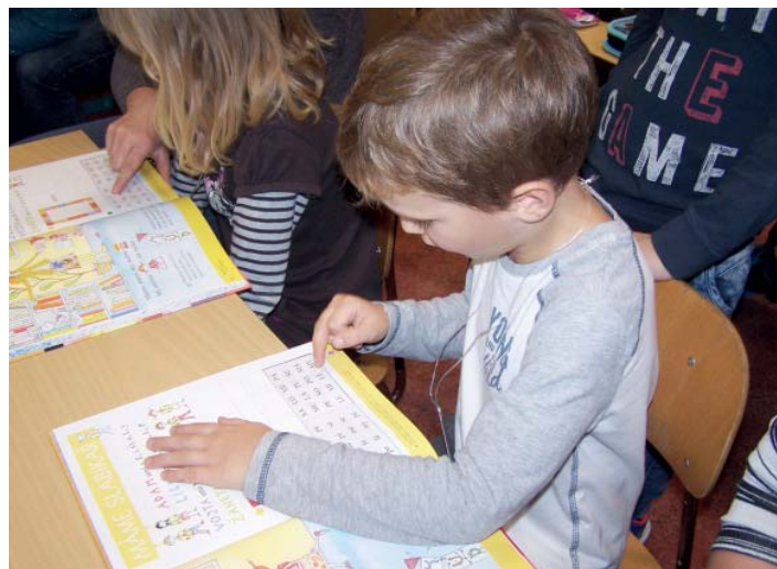
Žáci 1. třídy již čtou ve Slabikáři.

Rok utekl jako voda a máme před sebou Vánoce. Svátky, které jsou vnímány jako čas štědrosti, vděčnosti, víry, lásky a naděje v lepší budoucnost. O Vánocích se vytváří zvláštní kouzelná atmosféra. Každý ji prožívá jinak, ale určitě převládá láska, tolerance, soucit, přátelství. Někdo tráví svátky sám, jiný s rodinou, přáteli nebo jinými blízkými lidmi. Stejně jako nám se vybavují vzpomínky z mládí a dětství, zůstanou vzpomínky na tyto dny v mysli dnešní mladé generace. Advent. Slovo je latinské a znamená „příchod“. Děti ve škole jsou seznamovány s charakteristikou adventního období, které vrcholí 24. prosince na