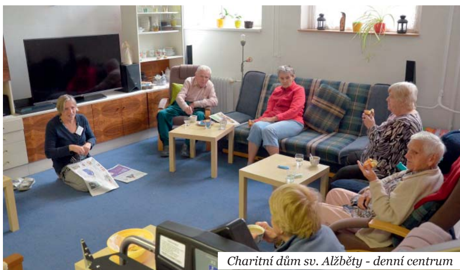
Charitní dům sv. Alžběty - denní centrum