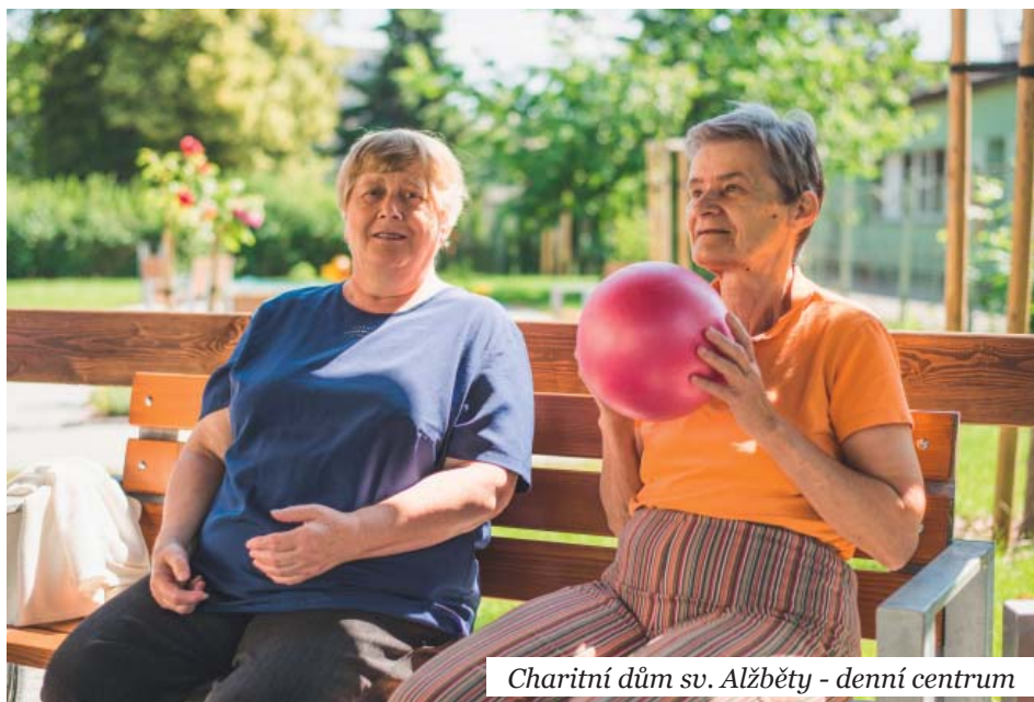
Charitní dům sv. Alžběty - denní centrum

Denní centrum je určeno pro seniory a dospělé lidi se zdravotním postižením, počínající demencí, smyslovými a pohybovými poruchami či jinými chorobami souvisejícími se stářím.