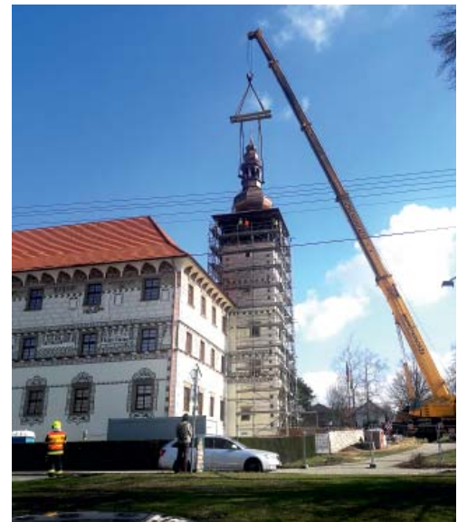
Už sedí...! Obdivuhodná práce! – 20. březen