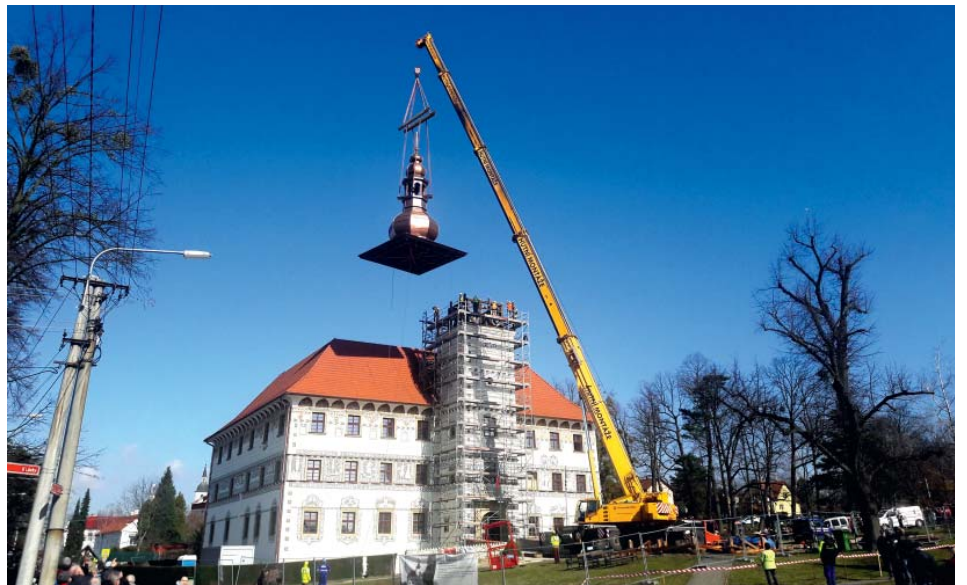
Výška dobrá, ještě kousek na sever – 20. březen

Konzultace byly vedeny již v r. 2015 a žádost na GO byla vypracovaná o rok později. Rozhodující bylo stanovisko Památkového ústavu a vy-