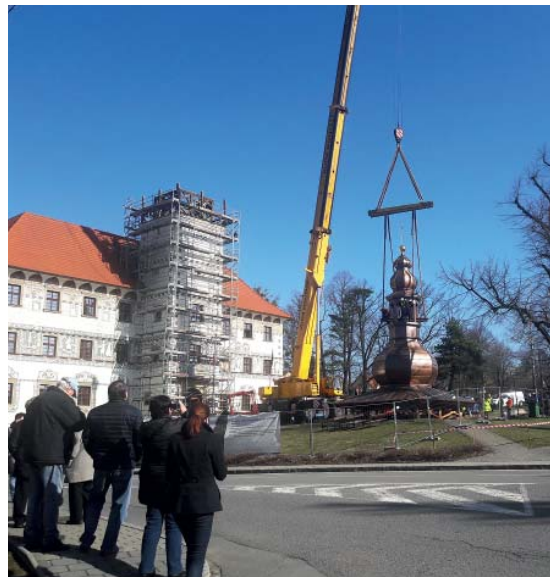
Báň už visí! – 20. březen.