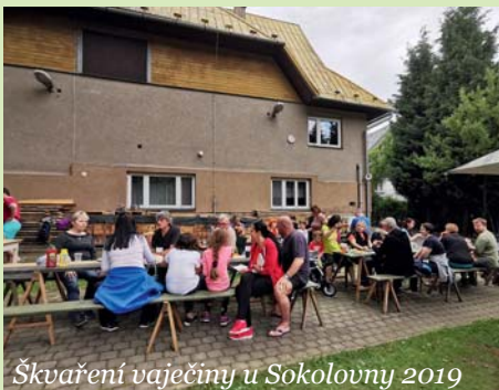
Škvaření vaječiny u Sokolovny 2019

Největším křesťanským svátkem jsou Velikonoce (v neděli a pondělí po prvním jarním úplňku) a po padesáti dnech následují Svatodušní svátky – Letnice. K těmto svátečním dnům se vztahuje i řada pranostik a lidových zvyků. Z pranostik je nejznámější „Na Svatý Duch do vody buch, po Svatém Duchu do vody v kožuchu“, asi nejlépe vystihu-