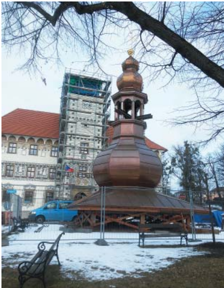
Věž už netrpělivě čeká... – 28. ledna.

Staroveský Zámek je s Proskovicemi spjatý nespočitatelnými vazbami. Historicky, hranicí katastrů, školou a žáky, rodinnými vztahy, v posledních letech Festivalem Poodří Františka Lýska a dalšími kulturními akcemi (Ondřejnica, výstavy, Večery na Zámku, cyklistika).