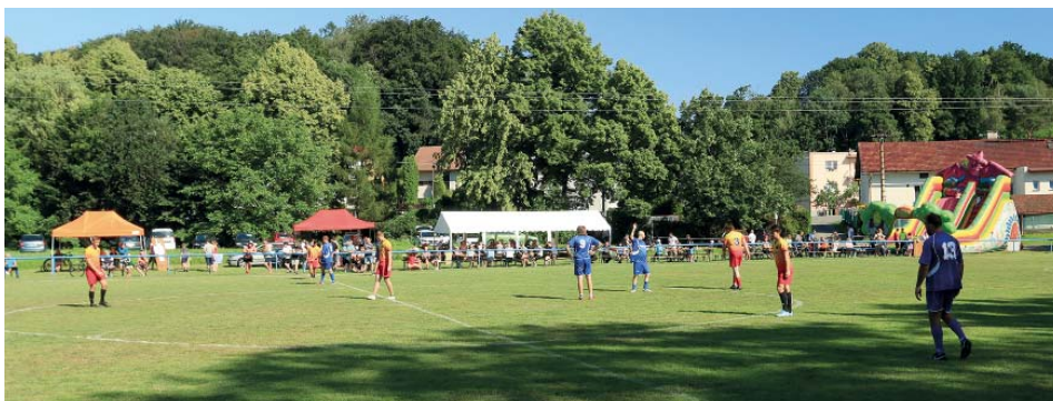
Pohled na diváckou kulisu.