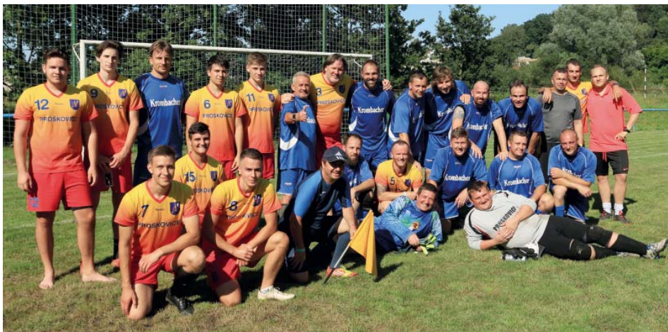
Společné foto svobodných a ženatých 2020.