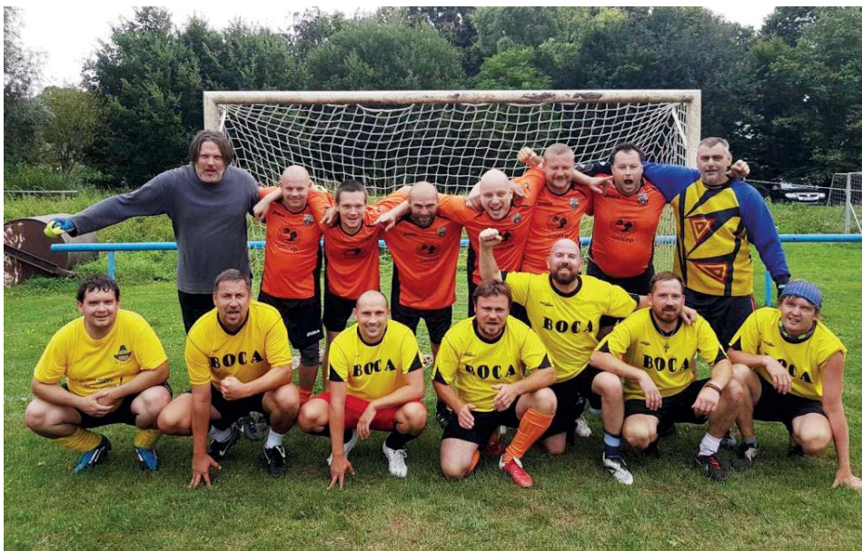
Společné foto dvou přátelenských týmů Beercelony a Bocy.