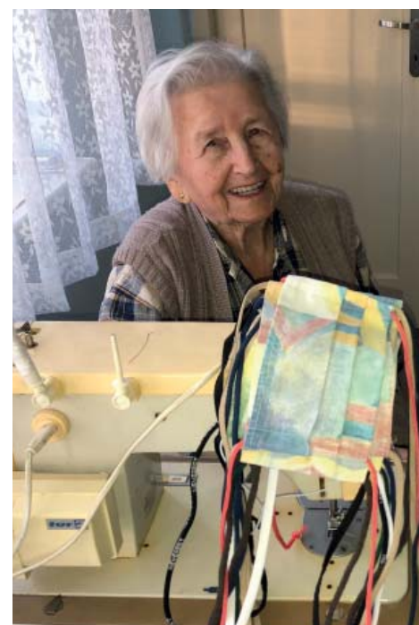
Vloni na jaře šila roušky