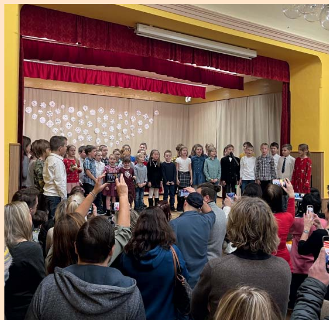
Vystoupení žáků 1.-3.ročníku na jarmarku.