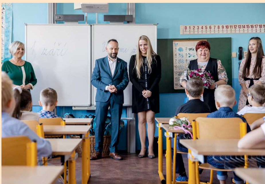
Návštěva primátora Ostravy ve škole 1. 9. 2022.