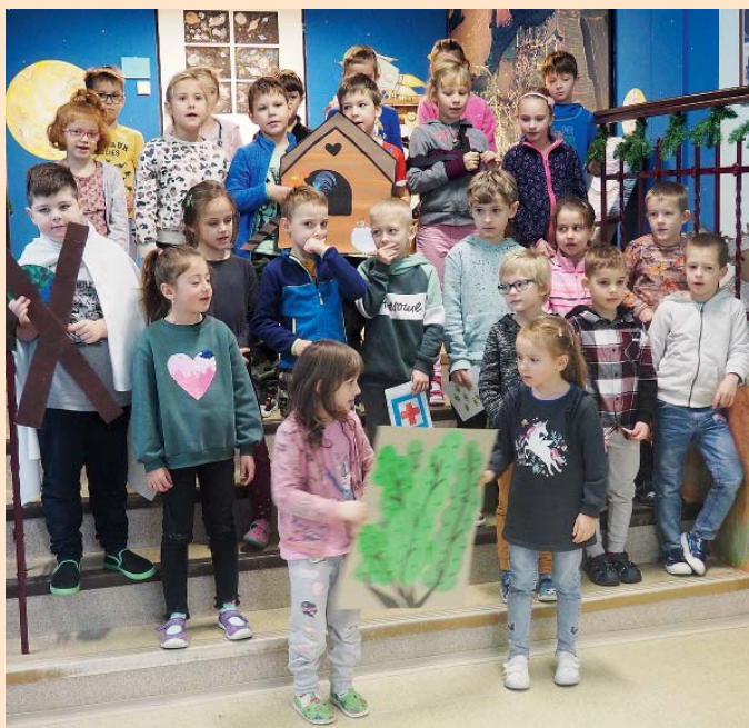
Vánoční zvyky rozsvícení 1. adventní svíčky, vystoupení 1. r.