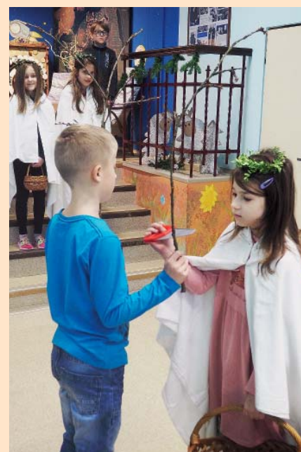
Rozsvícení 1. adventní svíčky.