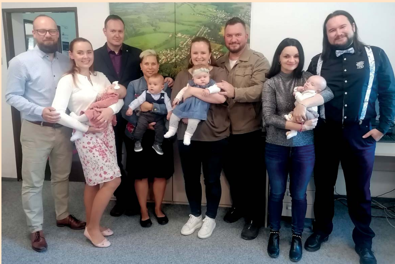
Začátkem října jsme přivítali další nové občánky.