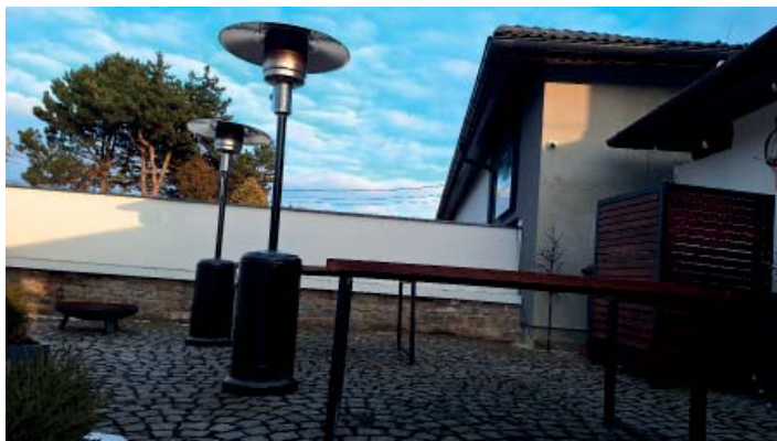
Dlažbu na dvoře i před restaurací zbavili plevele vlastníma rukama.