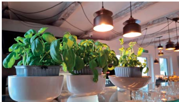
Čerstvé bylinky v interiéru Easy Pub.