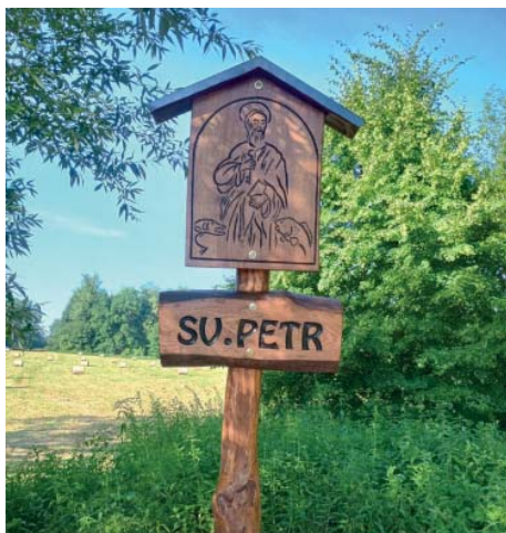
Sv. Petr, patron rybářů.

Vraťme se ale k tomu novému. Ke stávajícím označkovým POLANKA-STARÁ BĚLÁ (Honcula), STARÁ BĚLÁ-PROSKOVICE.