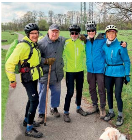
Setkání s Američany.

Cyklostezka byla již v dubnu ve vzorovém pořádku. Včetně směrovek a laviček. Tím jako celek skvěle slouží. Proskovicím dělá čest a údržbářům patří veřejné poděkování. Přidáváme jeden konkrétní důkaz: v úterý 21. dubna jsme se náhodou a krátce setkali se čtyřmi americkými turisty při jejich pohodové jízdě Krakov-Vídeň-Budapešť. Cyklostezkou byli nadšeni. Právem.