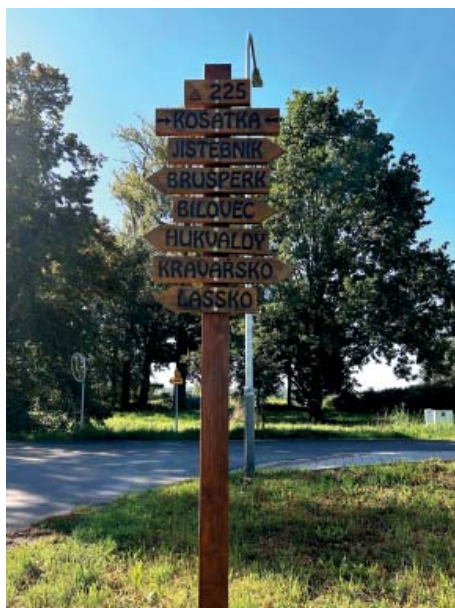
Směrovky z roku 2024.

První směrovky byly ve Vrbanisku umístěny před třemi roky v součinnosti se staroveským starostou panem Sedlářem.