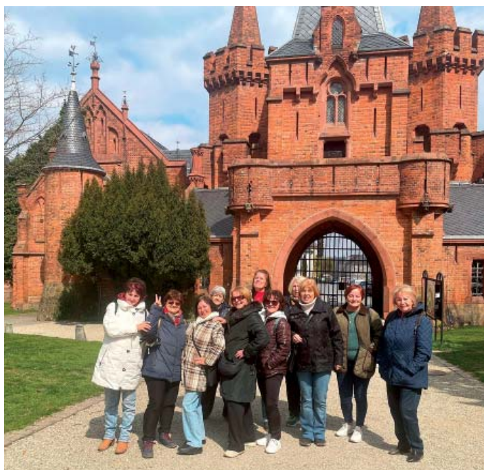
Členky kreativního klubu na výletě v Hradci nad Moravicí.

Jsem poměrně čerstvě ve funkci, teprve rok. Stávající členky výboru věděly, co to obnáší, a oslovily mě. A já nabídku přijala. Jsem v klubu nová a zároveň nejmladší, takže šlo i o to, aby se vedení postupně omladilo a klub pokračoval dál.