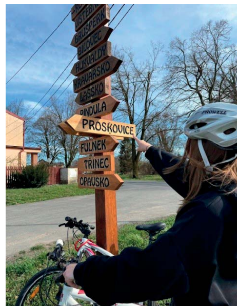
Rozcestník se všemi směrovkami.

A Opavsko? Rozhodnutí upozornit na našeho bezprostředního slezského souseda bylo jasné. Mnozí z nás jezdili a jezdí studovat a pracovat do samotné Opavy i na Hlučínsko. Jsou tam krásné zámky, pietní místa, přírodní skvosty i technické památky. Včetně přehrad. A pro cyklisty a táborníky? Pomalu ráj, který doporučujeme poznávat především okolo řek.