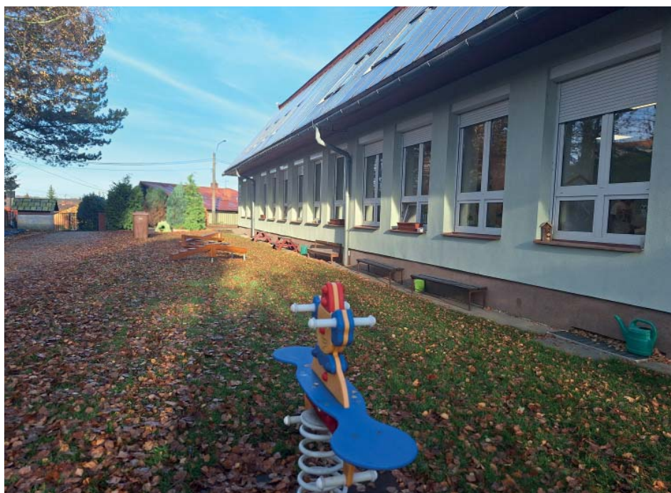
MŠ Proskovice, kterou navštěvuje pět desítek dětí.