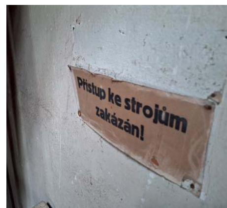
Cestou po schodech narazí návštěvník na původní ceduli ze starého mlýna.