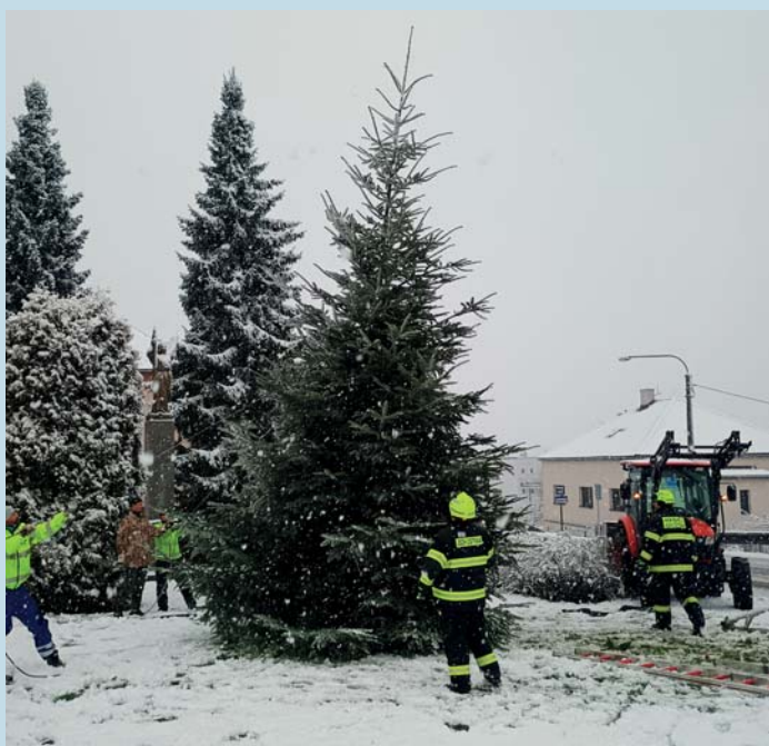
Pár silných rukou a může se zdobit.