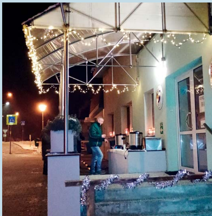
Příprava na rozsvícení stromu.