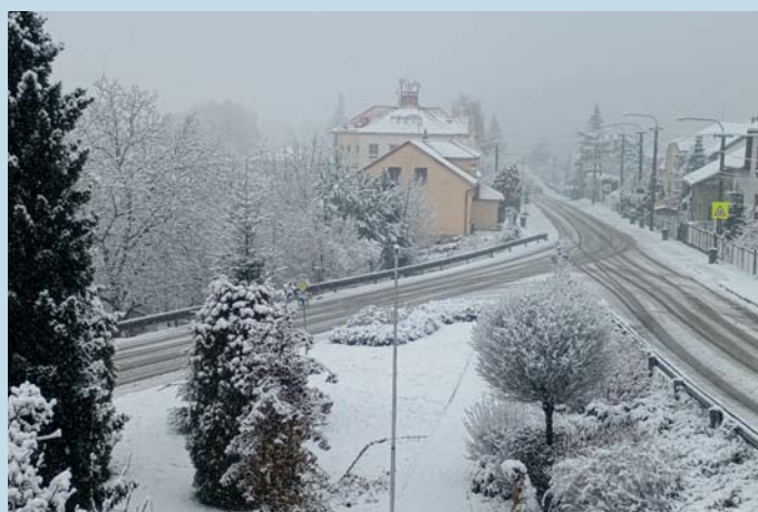
Sníh vykouznil vánoční atmosféru.