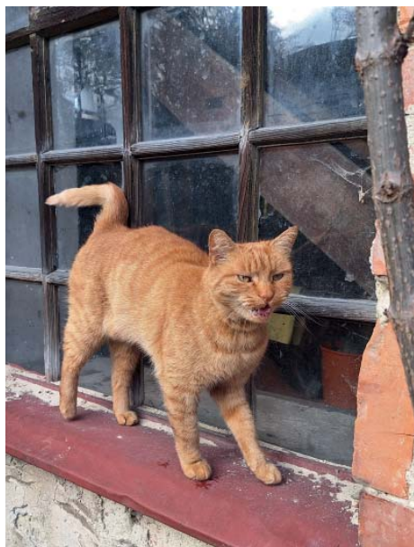
Kocour Gárfy přišel a už se nehnul.

Lucie oceňuje především klid a sepestí s přírodou: „To ticho, žádná auta, v létě slyšíte žáby. Práce na zahradě, prsty v hlíně... to je moje psychohygiena.“ S úsměvem dodává, že má i dvě kozy, které k mlýnu neodmyslitelně patří. Pavla vidí největší bonus v kombinaci prostoru