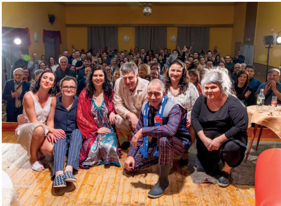
Derniéra posledního představení (A do pyžam!) odehraného souborem Proskovické divadlo Nad Struhou, z. s. v prostorách hostince U Psoty dne 12. 4. 2025.