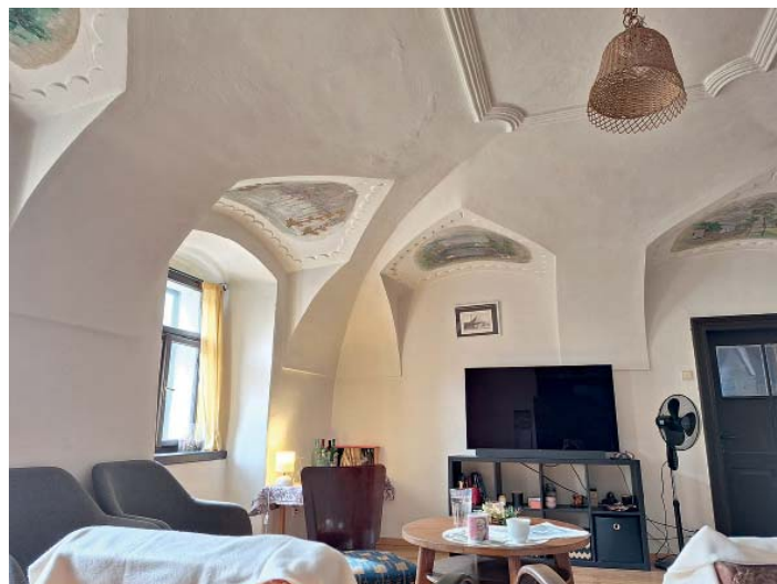
Máme tady velký vánoční strom, prostoru je dost, říká Lucie o společenském pokoji s klenbami.