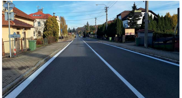
Ulice Staroveská po opravě září novým asfaltem a čerstvě nataženými bílými liniemi.