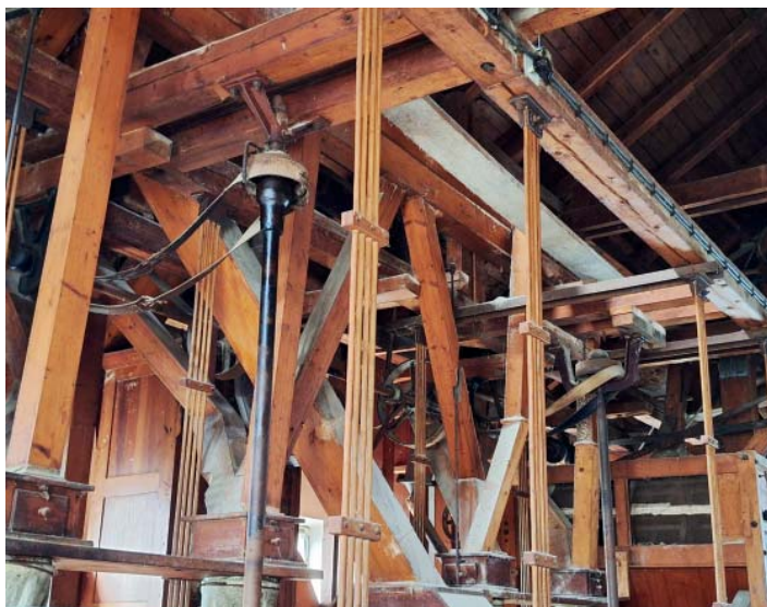
Půda mlýna ukrývá původní mlecí technologii.

Život ve mlýně není jednoduchý, zvláště pro lidi z města – Lucie je z Vyškovic