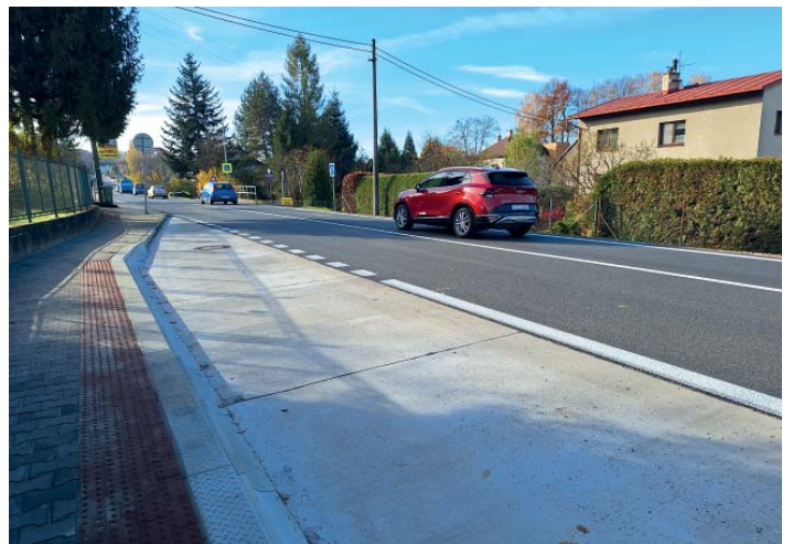
Zastávka po opravě.