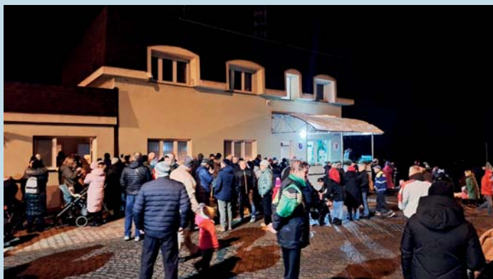
Hojná účast na rozsvícení stromu nás potěšila.