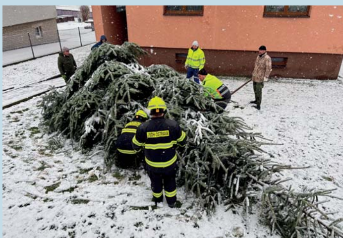
Vánoční strom opouští soukromou zahradu.