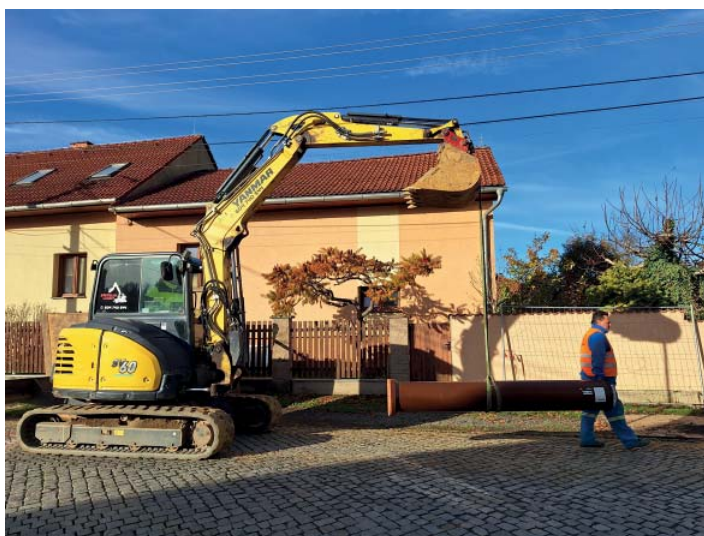
I přes posunutý start stavaři posouvají roury vstříc Kalužní.

„Pracovníci sice začali o něco později, ale do Vánoc by se měli dostat až k ulici Kalužní a dál se bude pokračovat podle počasí,“ uvedla starostka Proskovic Táňa Paličková.