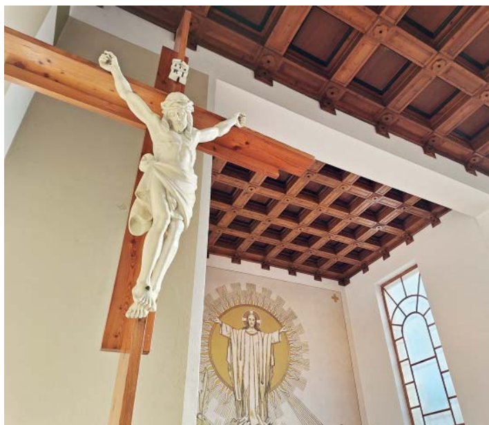
Interiér kostela sv. Floriána.