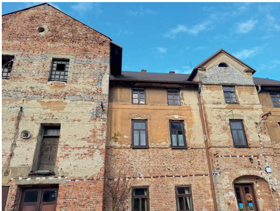
Historický mlýn v Proskovicích si dodnes uchovává svůj původní ráz.