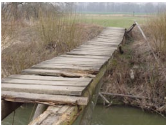
Lávka přes Ondřejnici před opravou

Jedno velmi výstižné přísloví praví, že „kdo se chváří, jako by se hov... mazal“. Přesto bych chtěl jménem rady městského obvodu poděkovat všem, kteří se nezištně podíleli na opravě a zaslouží