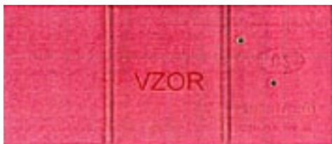
Typ 1: 1. 7. 1964 - 1986 Povinná výměna do 31. 12. 2007

Řidičské průkazy vydané od 1. 7. 1964 do 31. 12. 1993 (viz vzory):