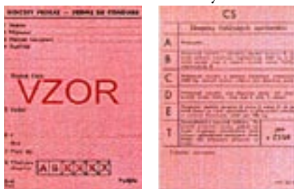
Typ 3: 1992 - 1993 Povinná výměna do 31. 12. 2007