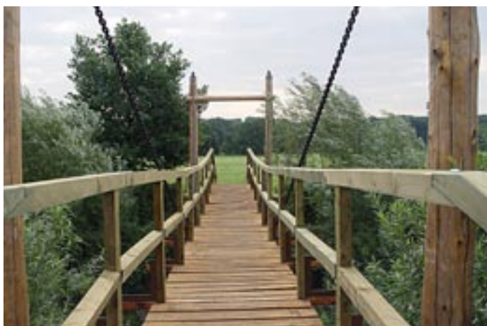
Lávka přes Ondřejnici po opravě