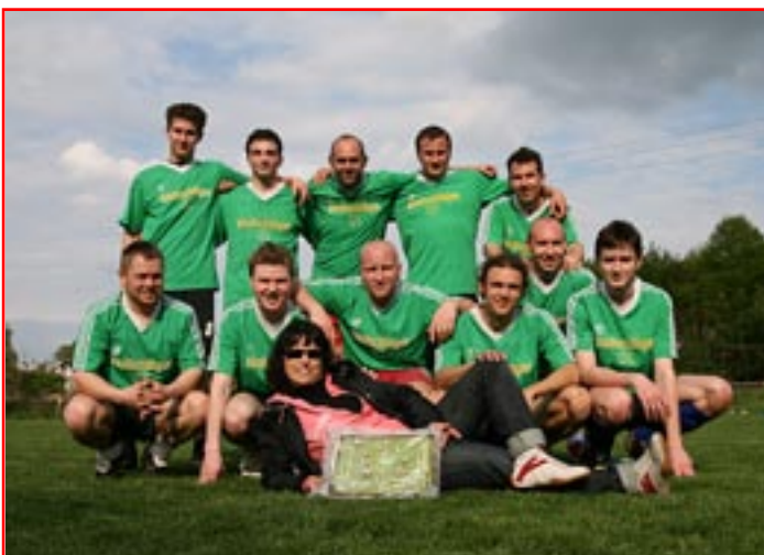
Vítězné mužstvo „SVOBODNÝCH“ z fotbalového utkání „Svobodní versus ženatí“ se svým sponzorem.