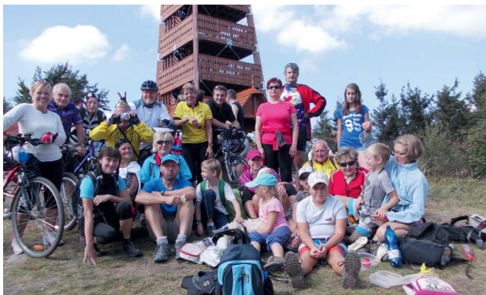
Proskovická výprava pěších a cyklistů na Javorník.

V letním Floriánovi jsem ohlásil vznik neformálního oddílu moravských cyklistů Proskovice a jeho první akci – Jízdu okolo Proskovic. Tím začaly i další zajímavé letní aktivity. Hlavně jsme zaznamenali sportovní úspěchy našich mladých spoluobčanů. Příkladně reprezentovali i s dospělými náš kraj a tím i Proskovice.