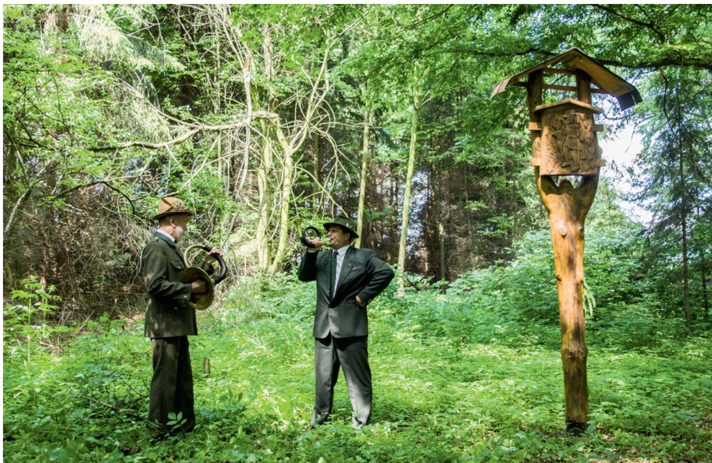
25. 5. 2014 – Slavnostní uvedení symbolu Svatého Huberta v Jarkově.