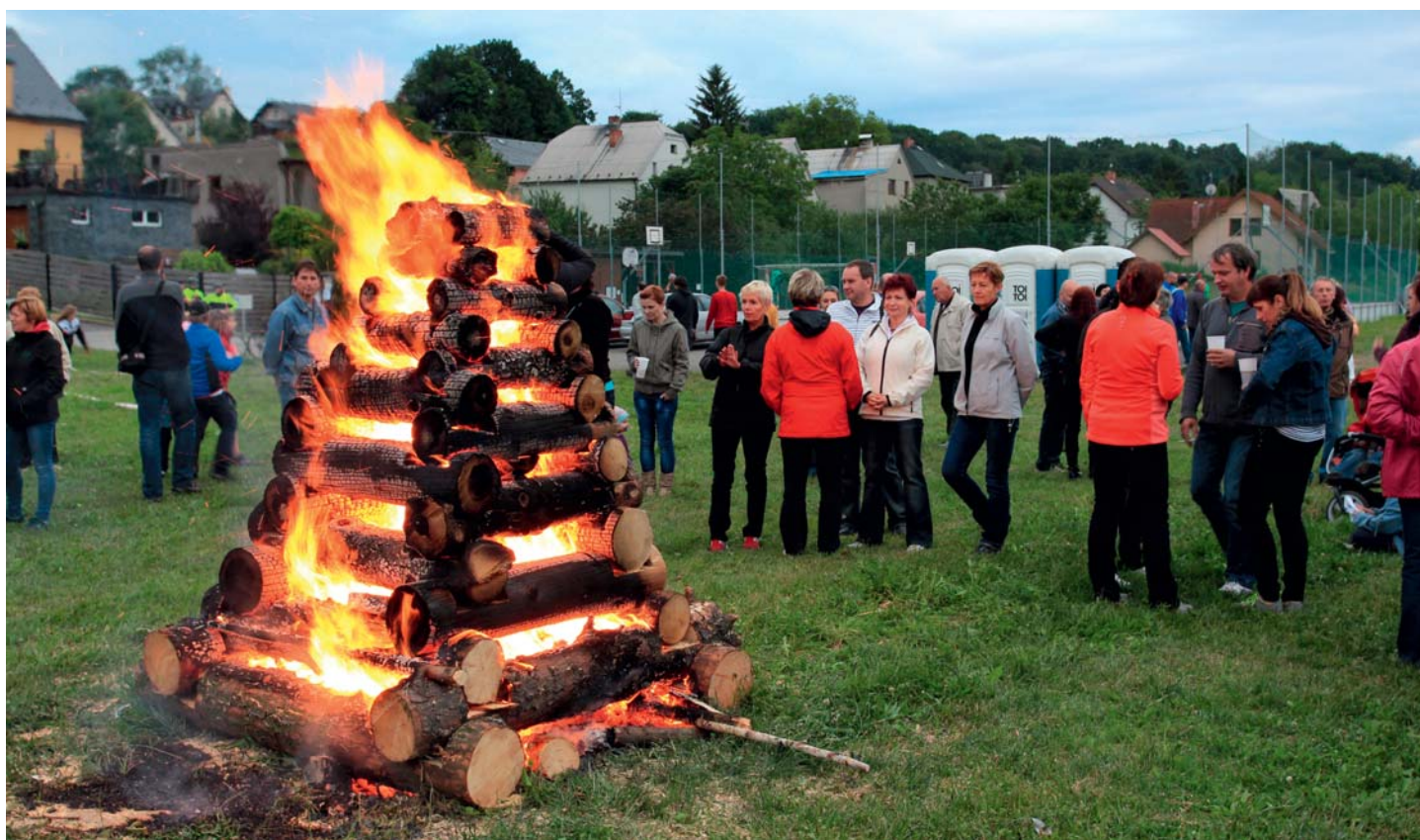
21. 6. 2014 – 4. ročník Svatojánských slavností, 620 let Proskovic.