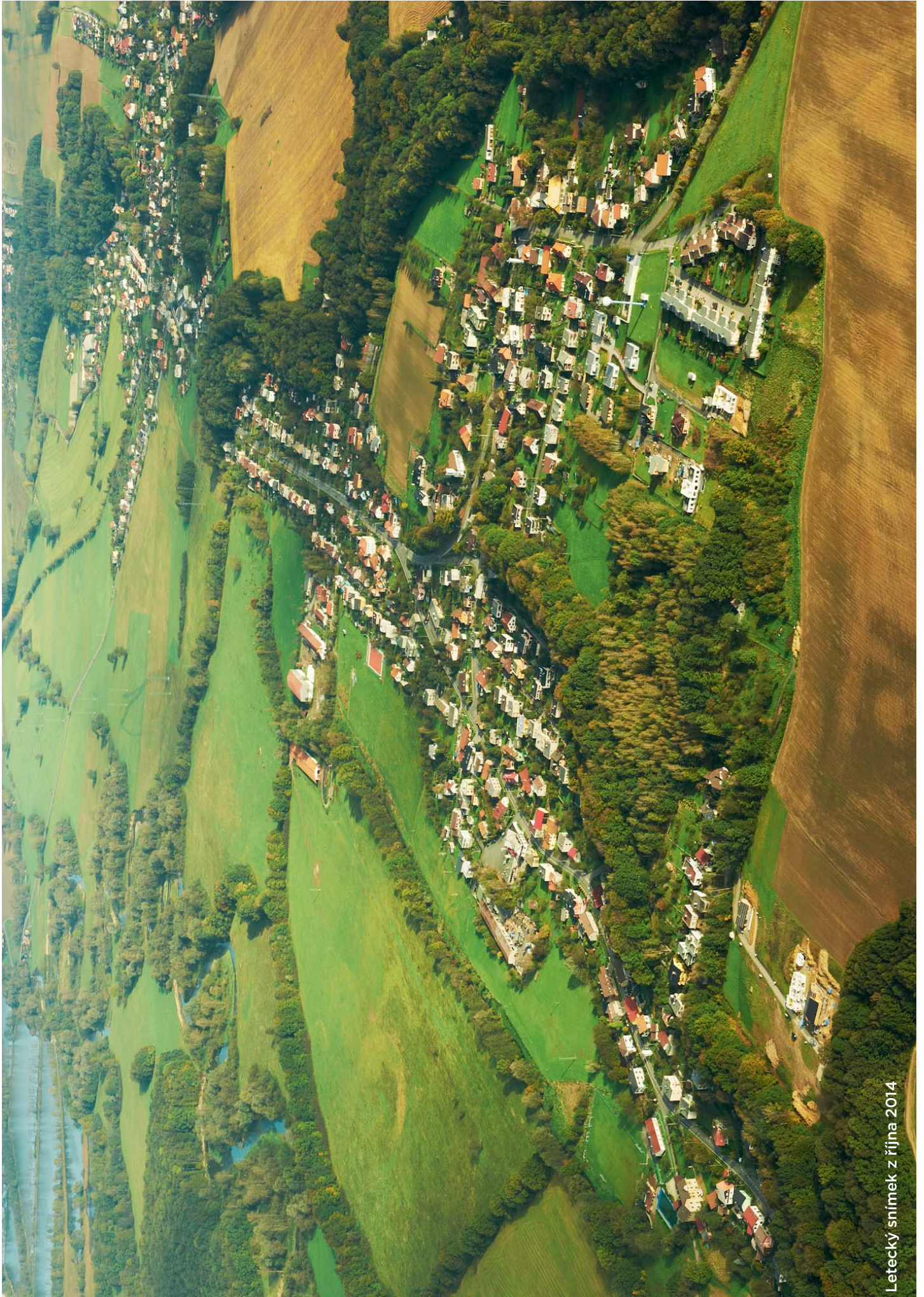
Letecký snímek z října 2014